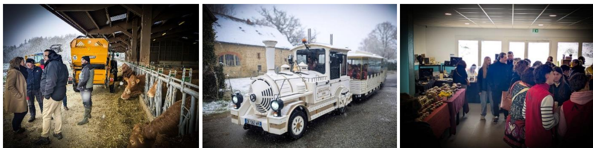
15 Mars 2025 : Filière Agricole - Portes Ouvertes de l'établissement