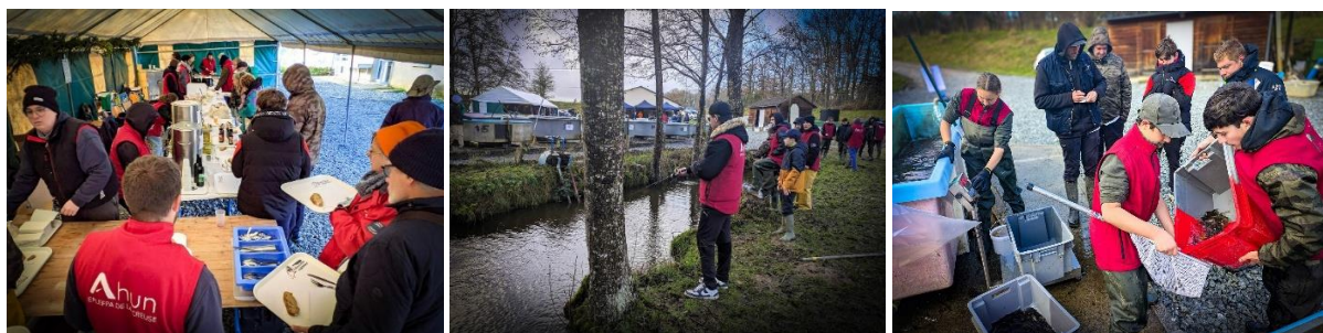
7 Décembre 2024 : Filière Aquaculture - Vente à la chaussée